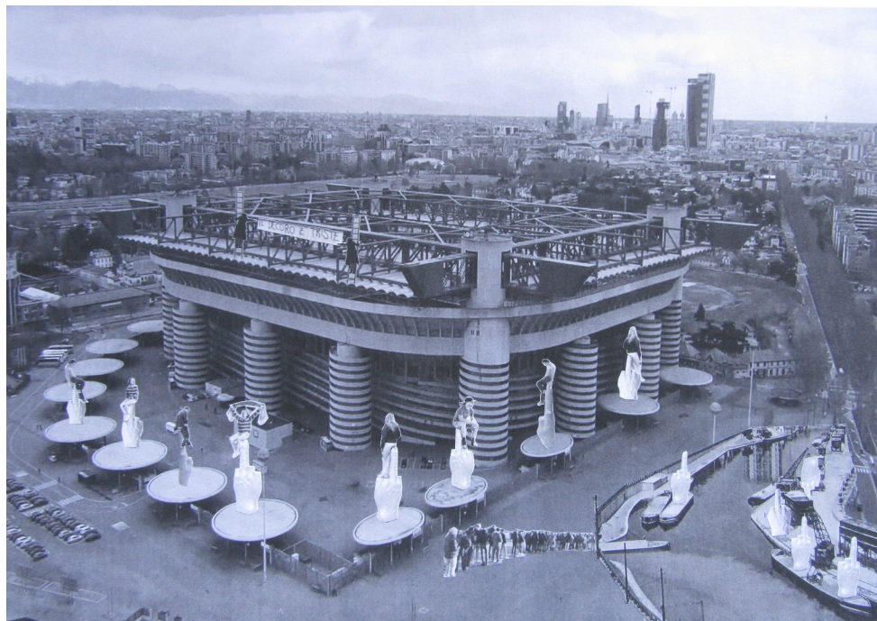
Parole, parole, parole - Vernissage