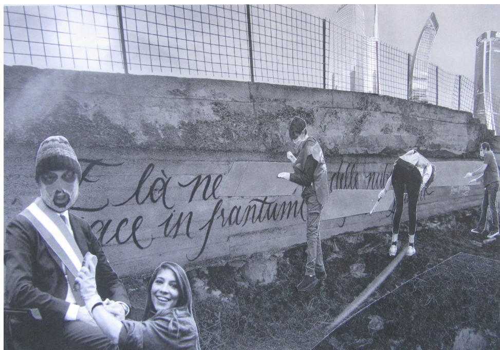
Pulirsi la coscienza – Guerra di religione