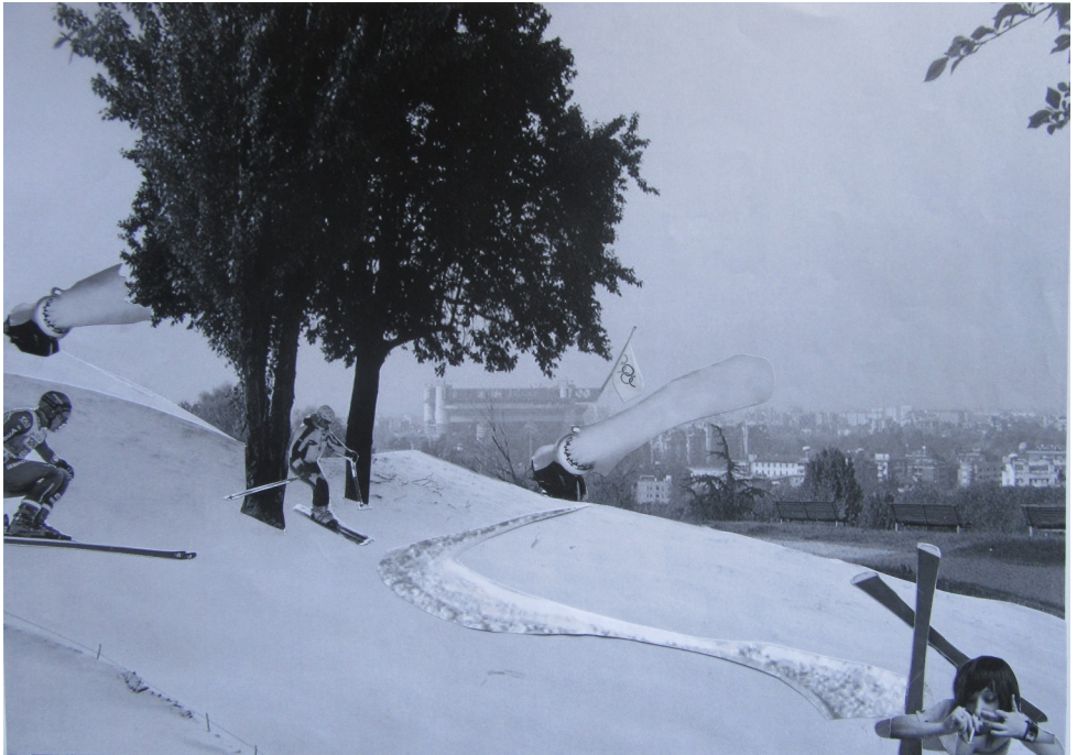
Neve - Albero di Natale