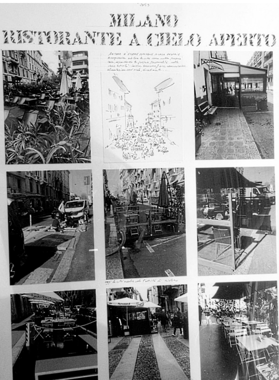
Milano ristorante a cielo aperto